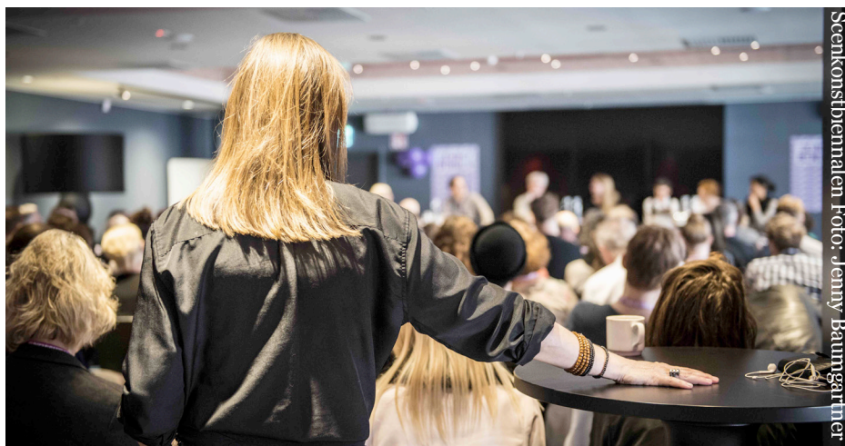
Scenkonstbiennalen