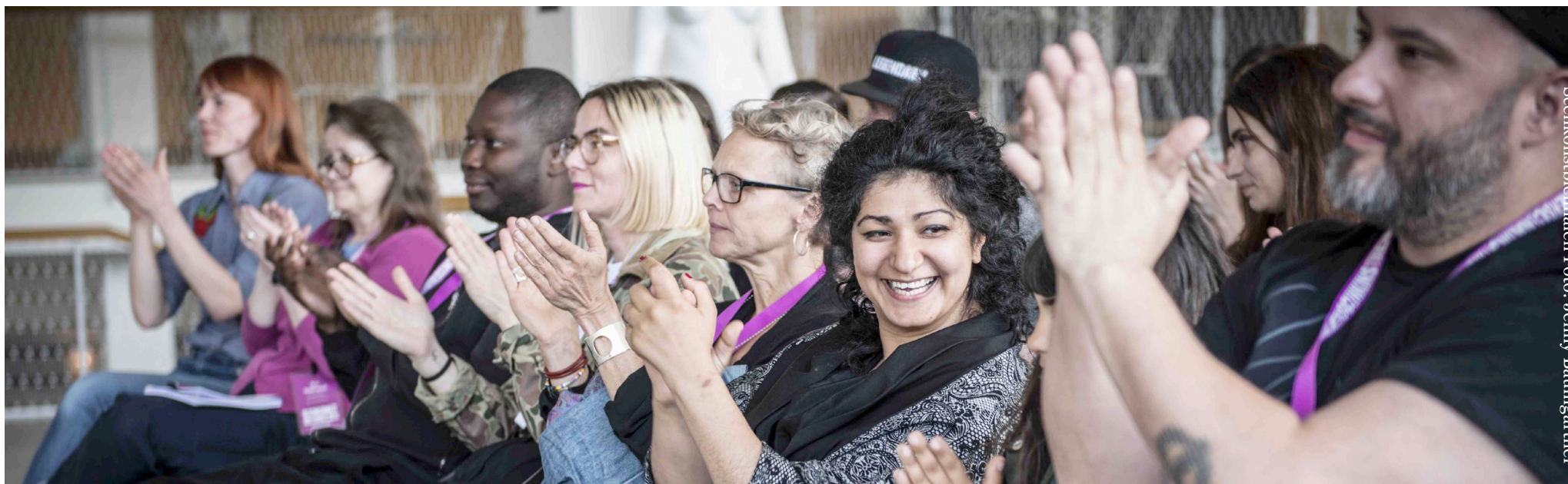
Scenkonstbiennalen