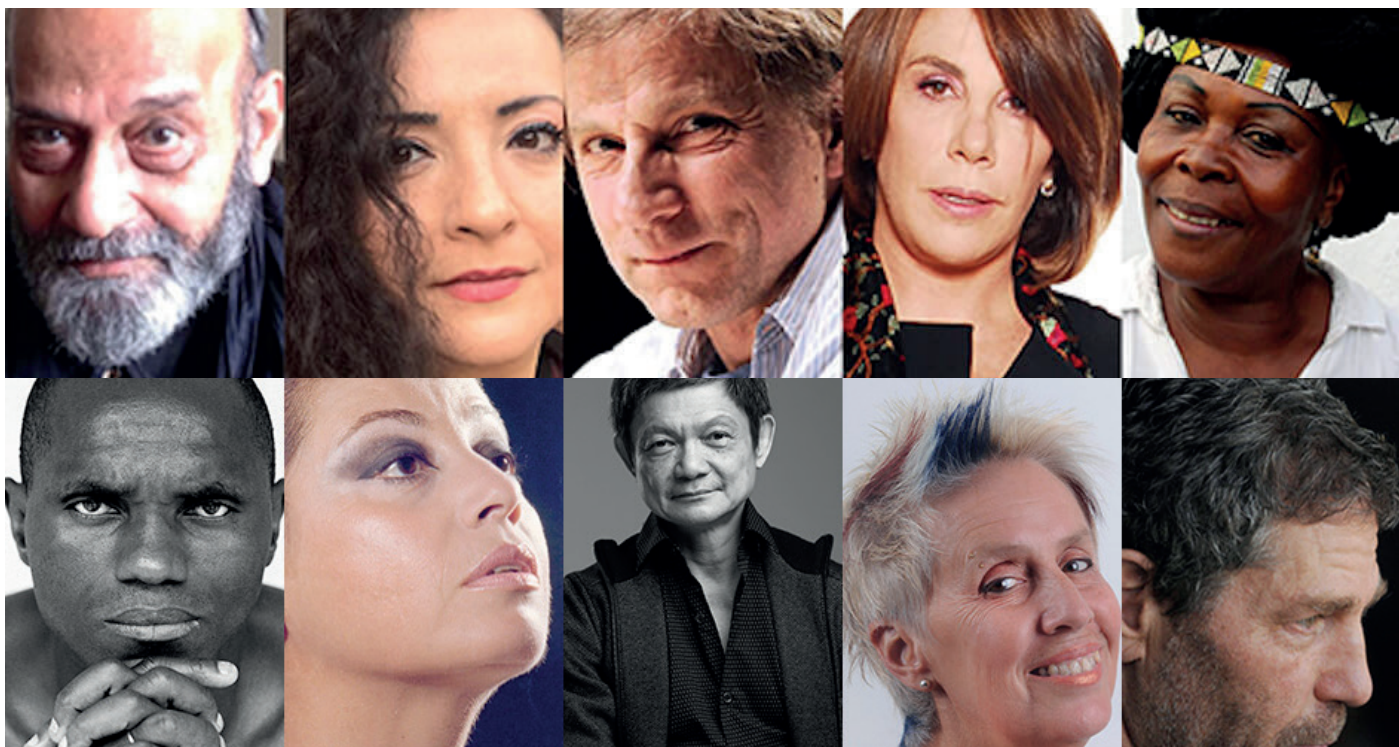
Världsteaterdagen / Världsdansdagen