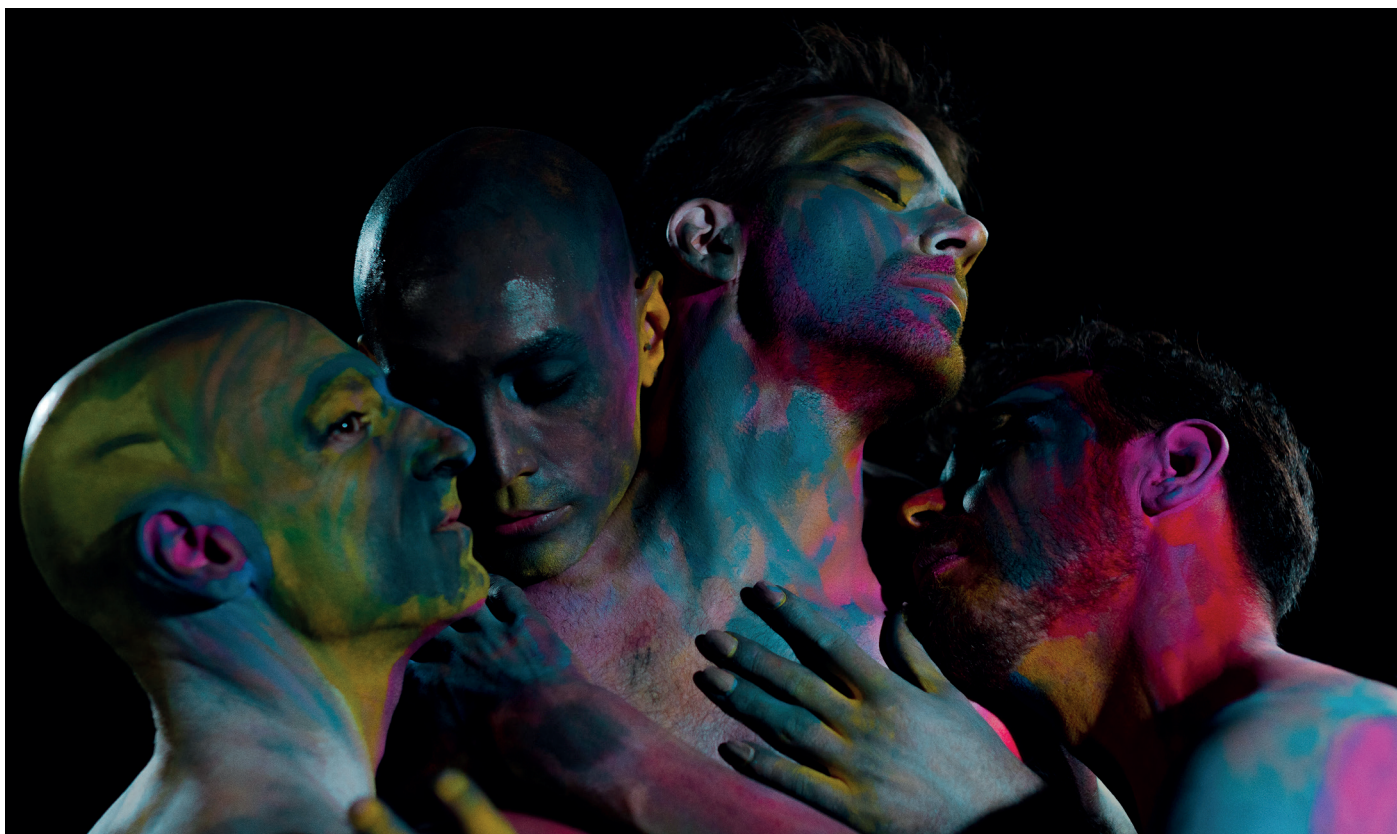
Los Indeseables/Nicolas Rambaud Dance Company