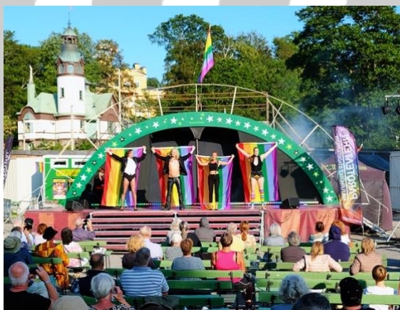
Queer as Opera/Stolt Scenkonst

Den 14–16 juni arrangerade vår medlem Dansstationen i Malmö för tredje gången Stolt scenkonst, med föreställningar inom dans, teater och drag, för barn och vuxna.