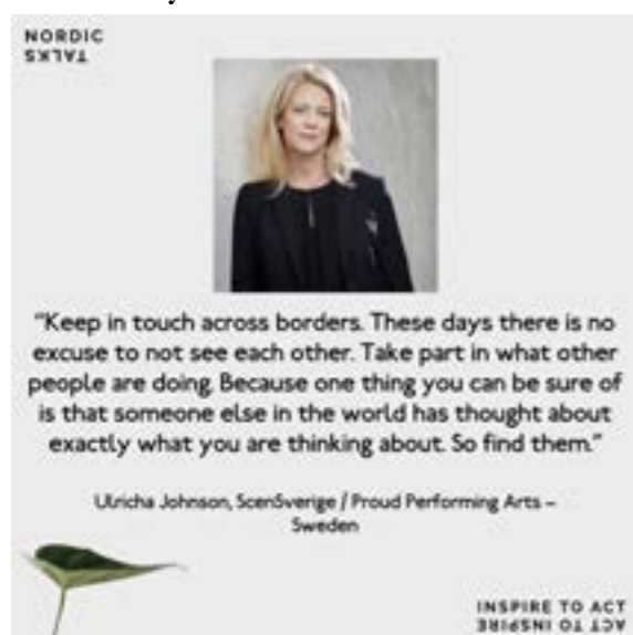
Från Cut the Cord

Scensverige medverkar till att på olika sätt sprida svenska pjäser i översättning. Det finns en fortsatt stor internationell efterfrågan och kontinuerligt sprider vi antologin 5 x Swedish Plays for Children and Youth från 2001 och 6 x Contemporary Swedish Plays som producerades 2008. Inom ramen för utbytet med Ryssland publicerades i december 2015 en antologi med fyra samtida svenska pjäser översatta till ryska.