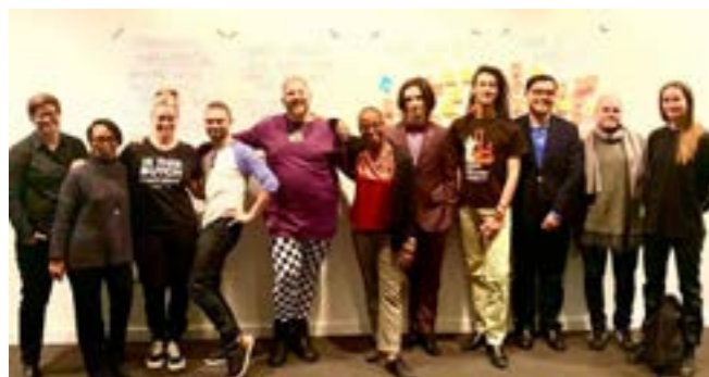
Från thelong table i House of Scandinavia

I januari befann sig Scensveriges kansli i New York för att driva en satsning för att fler svenska scenkonstnärer ska få möjlighet att nå nya internationella målgrupper och skapa nya samarbeten. Vi deltog i festivalerna APAP, ISPA, Under the radar och In the works. Vi hade möten både med våra nordiska och kanadensiska kollegor inför det nordiska temat som Kanada satsade på 2021 (nu uppskjutet till 2022). Scensverige kommer vara ett av kontaktcentren för arrangörerna för att lyfta flera av våra medlemmar. Vi arrangerade ett long table i House of Scandinavia tillsammans med vår amerikanska systerorganisation Theatre Communications Group. Detta var det fjärde officiella internationella mötet i arbetet med att fördjupa kontakter och erfarenheter för personer och organisationer som jobbar med HBTQ-perspektiv, både på och bakom scenen. Bland deltagarna från USA fanns flera vi arbetat med förut, samt ett tiotal nytillkomna.